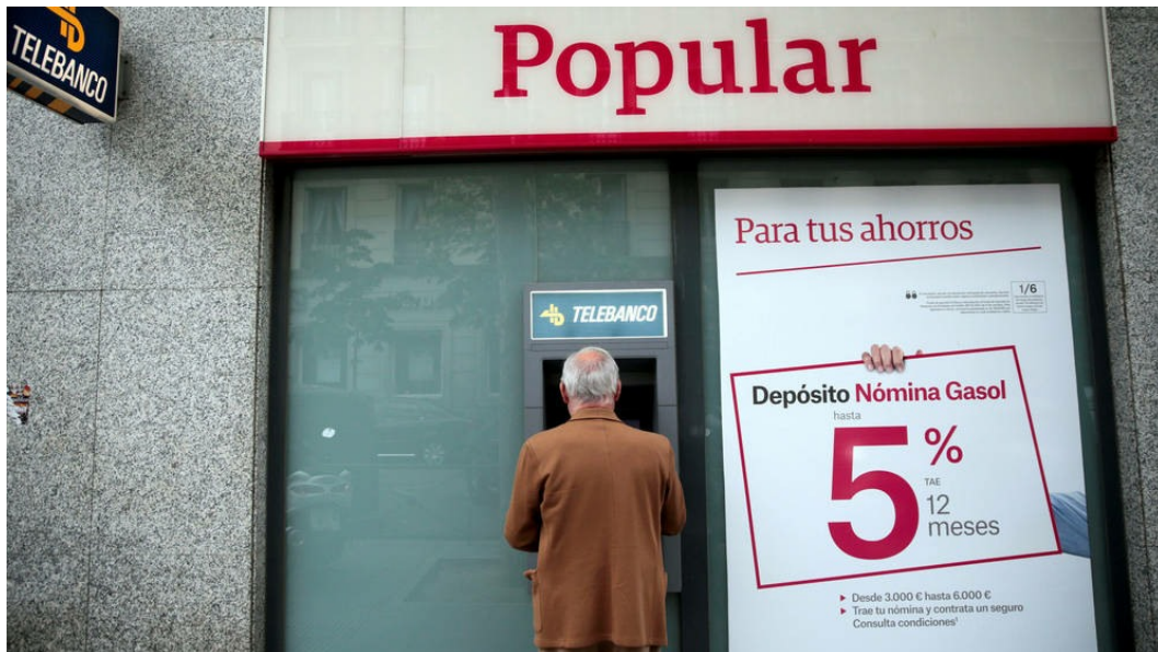
Una sucursal de Banco Popular.

Los contribuyentes afectados por la resolución del Popular podrán compensar pérdidas con ganancias. El tratamiento es diferente si aceptaron los bonos de fidelización del Santander